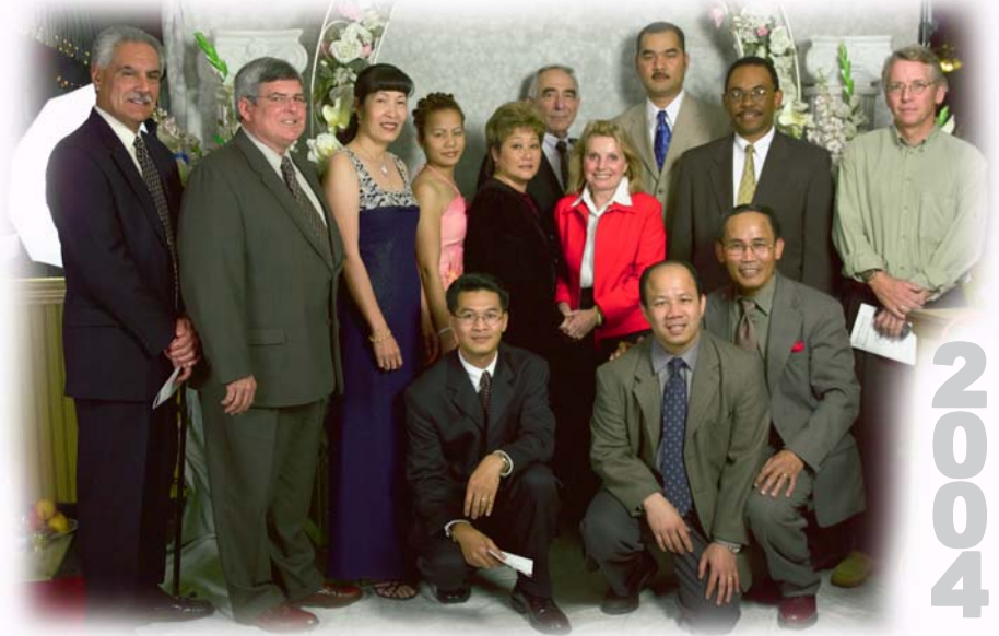
"Recognizing our sustaining supporters" March 19, 2004 at Mirage Palace

We would Like to Express Our Gratitude and Thankfulness for Your Generous Support's And Your Presence in Our Inauguration