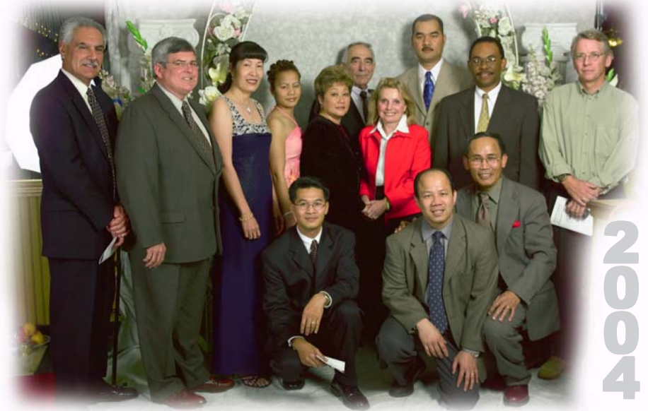
"Recognizing our sustaining supporters" March 19, 2004 at Mirage Palace