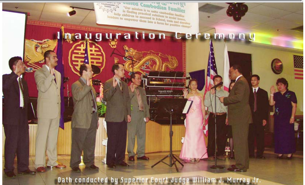
Oath conducted by Superior Court Judge William J. Murray Jr.